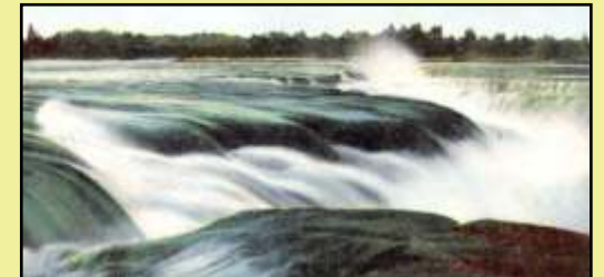
Chutes de la Chaudière, XIXe siècle

une vitrine pour l'histoire autochtone ancienne et l'histoire collective plus récente