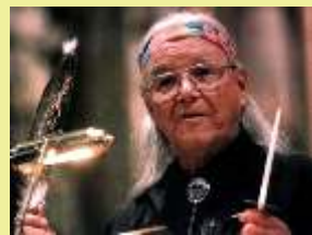
Dr. William Commanda Aîné algonquin, OC

Plans conceptuels de l'architecte Douglas J. Cardinal